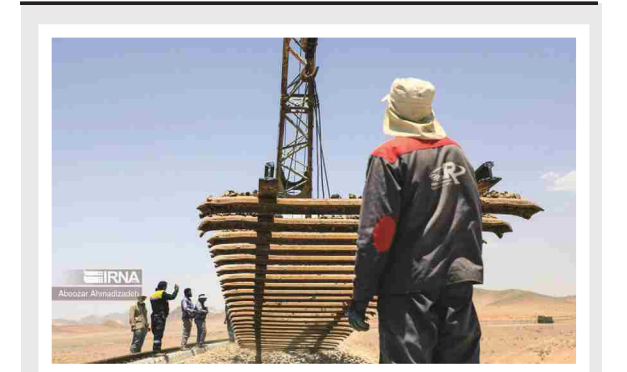
مدیرعامل راه آهن: